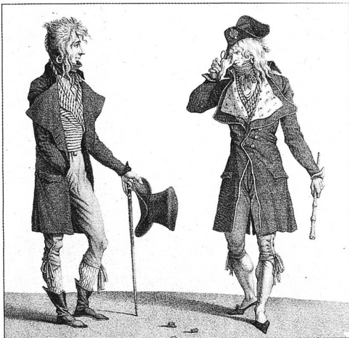
Abb. 5 Charles Vernet, "Incroyables" (1775)