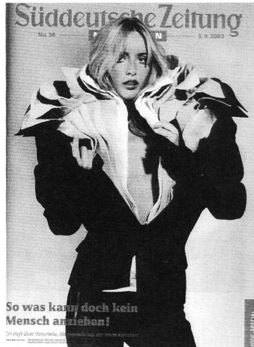
Abb. 9 Viktor & Rolf (Winter 2003/04)

Die Übersteigerung modischer Formenelemente zeigt auch sehr schön eine Mischung aus Kleid, Anzug, Hemd, Pierrotkostüm, alles in scheinbar gänzlich verschobenen Proportionen. Ein anderes Modell führt noch deutlicher das Prozesshafte jeder und insbesondere dieser Moden vor: Ein Kleid wird erweitert, immer wieder kommt eine weitere Schicht hinzu, Kleid schichtet sich auf Kleid, Mantel auf Mantel, bis am Ende ein nahezu unförmiges, aber auf seine Art immer noch schönes Gebilde steht, das den menschlichen Körper, der in ihm steckt, nicht einmal mehr ahnen lässt. Er wurde buchstäblich in unzähligen Schichten von Kleidung verloren, als nichtig erklärt, er ist der Kern des Kokons, der sich um ihn spinnt und eigentlich immer weiter gehen könnte. Der modische Prozess thematisiert und reflektiert sich selbst; Mode wird selbstreferentiell wie die moderne Kunst, sie erzählt Geschichten über Kleider wie die postmoderne Kunst Geschichten über andere Geschichten erzählt – und sie veranschaulicht, dass einer der generierenden Impulse der Mode ein grotesker ist.