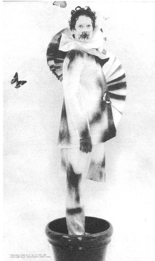
Abb. 7 Viktor & Rolf Head over Heels (1998)