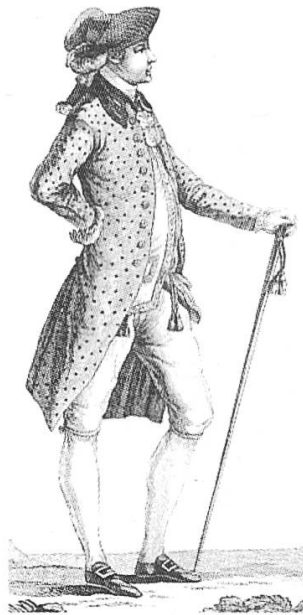
Abb. 4 Ein "normaler" französischer Herren- anzug von 1778