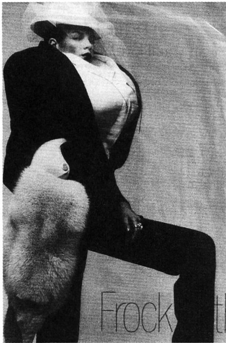
Abb. 8 Viktor & Rolf (1999)