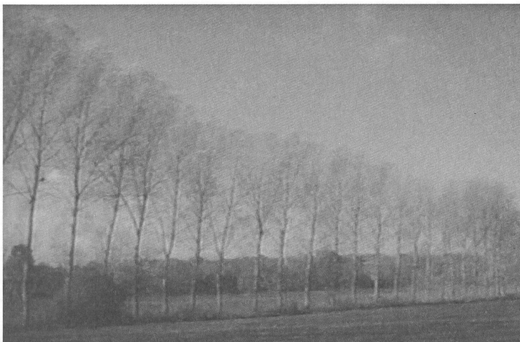
M. Duras: Aurélia Steiner Vancouver (1979).

Que peuvent ici les images pour "traduire" le texte? Le rapport texte-image se fait dans un rapport de soumission: des correspondances, comme une gare désaffectée, en ruine, qui pourrait rappeler celles des camps d'extermination, ou encore l'alignement de ces troncs d'arbres coupés qui évoquerait l'alignement des corps suppliciés. Mais la caméra, en de très longs plans, filme la mer, la plage déserte, des champs et des ciels, neutres, loins de l'histoire, et détachés du drame humain. 16