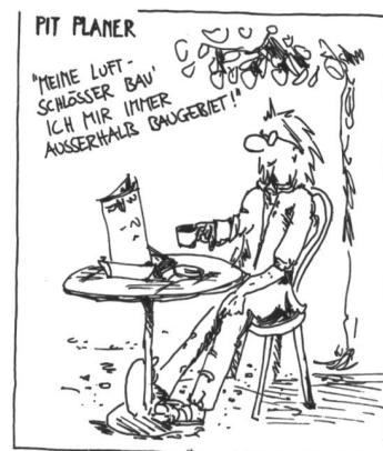
Illustration: Daniel Grob

Die vier Letztgenannten sind Kreisplaner beim Amt für Raumplanung, und ihr Austritt erfolgte wegen Erhöhung des Mitgliederbeitrages von Fr. 200.- auf Fr. 400.- (der Kanton hatte bisher diese Beiträge übernommen, war aber nach der obigen Erhöhung nicht mehr gewillt, hierfür aufzukommen).