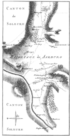
Karte Region Wiggertal um 1767 mit alter und neuer Bernstrasse «Grande Route»

Ich denke der eingeschlagene Weg der Richtplannungen ist richtig. Hingegen müssten die Zielsetzungen grössere Spielräume einhalten, weniger nutzungsorientiert sein (Nutzungen sind immer kurzzeitig), mehr an umkehrbaren und nicht umkehrbaren Prozessen orientiert sein.