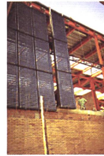
Fassadenintegrierte Photovoltaik-Anlage (53 kWp) des Mataró Bibliotheksgebäudes, Barcelona, Spanien.

Verbreitet ist das bedeutsame Potenzial der Photovoltaik zu einer nachhaltigen städtebaulichen Entwicklung (anerkannt, jedoch steht die Umsetzung erst am Anfang. Im Rahmen des europäischen Projekts «PV City Guide» werden die umsetzungs-relevanten Sachverhalte aufgegriffen. Unterschiedliche lokale Rahmenbedingungen (Struktur des Gebäudeparks, Dynamik, Traditionen, Bedarf an Neubauten und Sanierungen, Schutzauflagen, Finanzierungswesen, Netzwerke, usw.) werden immer zu lokal oder regional unterschiedlichen Lösungen führen. Der Workshop zeigt sowohl die Unterschiede wie die Gemeinsamkeiten für künftige Photovoltaik – Stadtprojekte, Anforderungen und Erfahrungen sowie übersichtliche Lösungsansätze und Entscheidungshilfen auf.