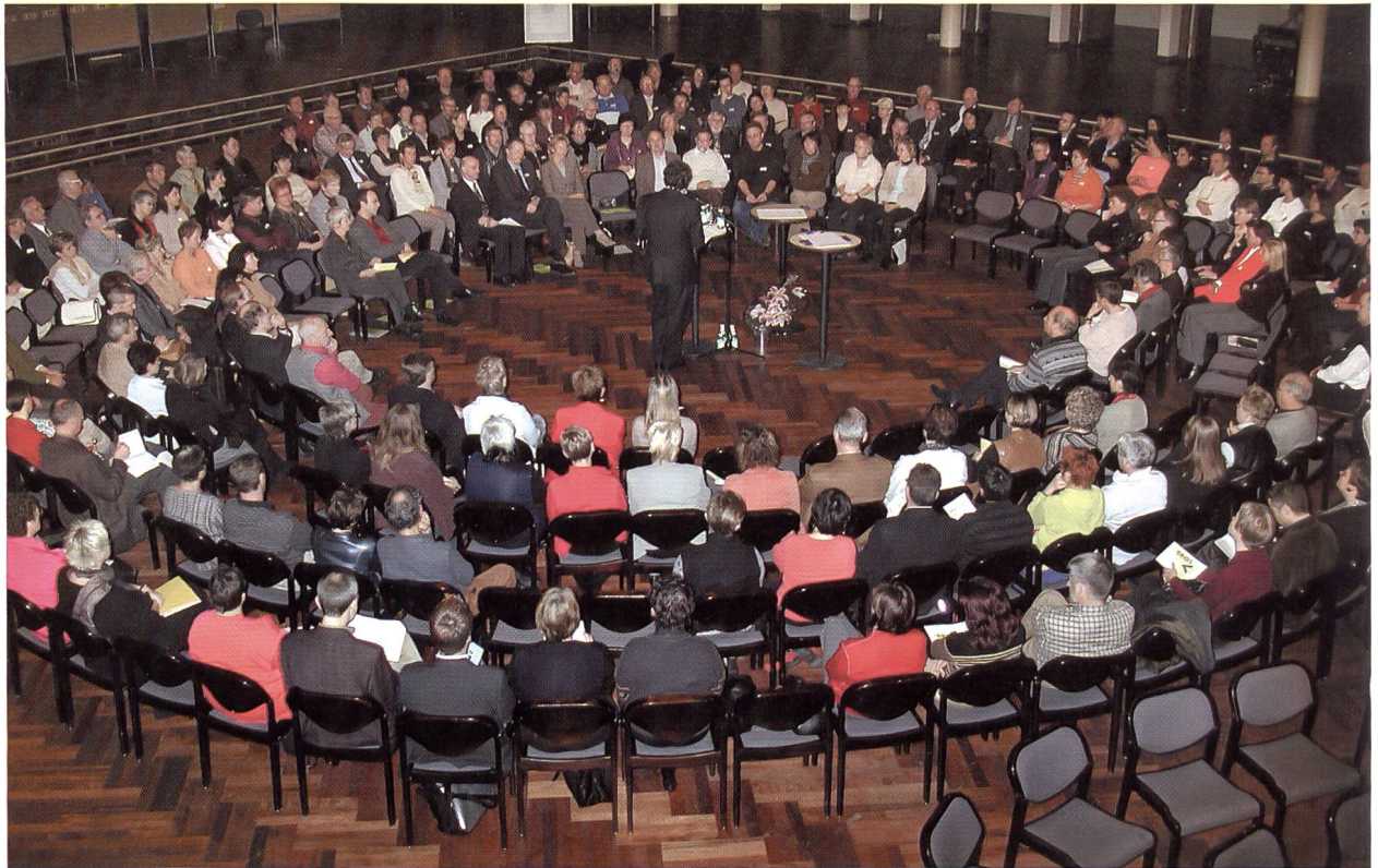
Eine Form der drei Grossgruppenkonferenzen: «Open Space Methode»