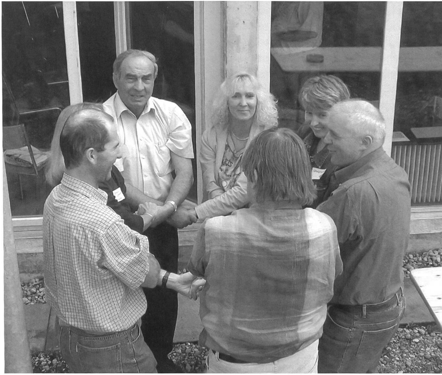
Teilnehmende einer Zukunftswerkstatt (Ersigen)