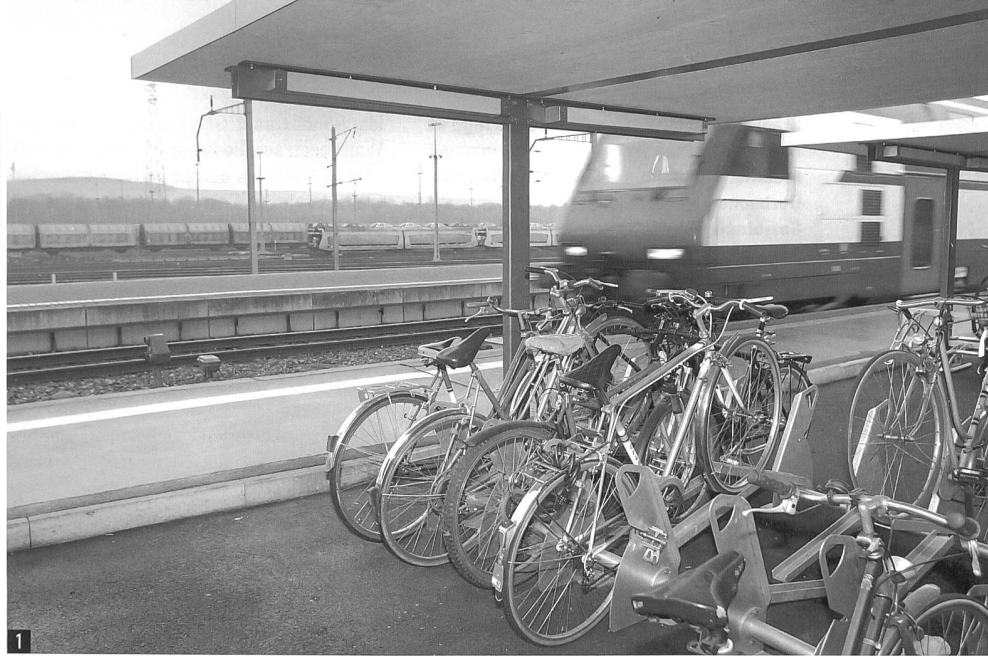
1 Attraktive Velo-Infrastruktur und velofreundliche Verkehrsplanung motiviert zum Umsteigen aufs Velo.