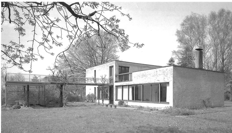
Das Haus Senn in Riehen wurde 1934 unter Leitung der Basler Architekten Otto und Walter Senn erbaut. Es ist eines der herausragenden Beispiele im neuen Faltblatt «Baukultur entdecken – Neues Bauen in Riehen».

Die Diskussion soll zudem den Blick darauf lenken, dass der Raumentwicklungsbericht in zweifacher Hinsicht von zukunftsweisender Bedeutung ist: Zunächst erhofft sich das ARE von seiner öffentlichen Diskussion substantielle Anregungen für die Überarbeitung der «Grundzüge der Raumordnung Schweiz» von 1996; darüber hinaus wird davon ausgegangen, dass der Raumentwicklungsbericht in mehr oder weniger grossem Umfang Änderungen bei der Revision des RPG nach sich ziehen wird.