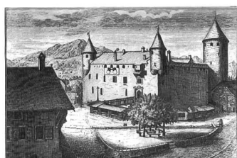
Gravure du château de Bulle (Topographie de la Suisse, D. Herrliberger, 1754-58):

L'information sur la nature et le contenu des lieux doit ainsi se doubler d'autres approches. Elles sont avant tout de deux ordres: l'iconographie ancienne et la reconnaissance du terrain actuel. Les gravures anciennes, puis les photographies sont des sources d'un apport précieux. Accumulés et confrontés, les divers plans et anciennes «vues» vont restituer une image partielle certes, mais objective et variée de l'aspect des lieux. L'autre approche, entreprise par la mémoire du lieu, en particulier lorsqu'on ne possède rien ou presque sur un lieu, est «l'analyse de site».