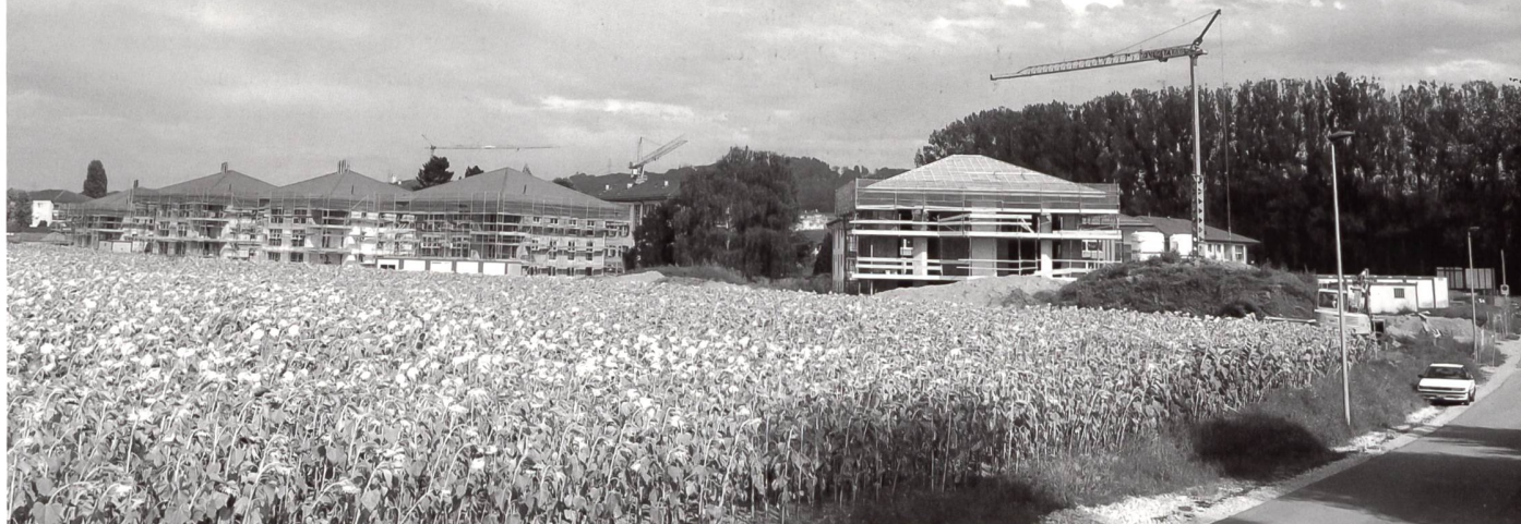
Les petits immeubles en construction à Cheseaux

Le soudain engouement pour la réalisation d'immeubles d'habitation collective a constitué un défi pour les autorités communales. Pour en savoir plus, collage a interrogé les politiciens responsables de l'urbanisme de deux communes suburbaines de l'agglomération lausannoise qui se distinguent par la proximité de Lausanne mais qui présentent des problèmes très spécifiques.