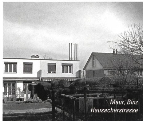
Maur, Binz Hausacherstrasse

Verschiedene Beispiele für bauliche Verdichtungen.