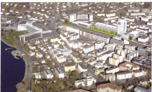
Projet «Quadrant Nord-Ouest», Mayor+Beusch architecture & urbanisme, Transitec SA, B+C Ingénieurs SA