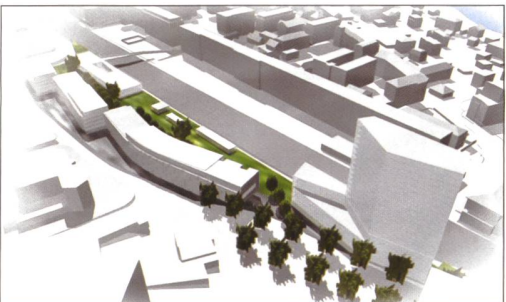
Projet «Vevey Ville+», U15 architectes, Citec SA, Bonnemaïson