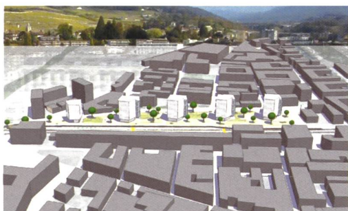
Projet retenu au deuxième tour: «VEVÉCOVILLE», Bellmann architectes, Plarel architectes urbanistes, Christe et Gygax, Atelier du Paysage J-Y Le Baron, C'S'D