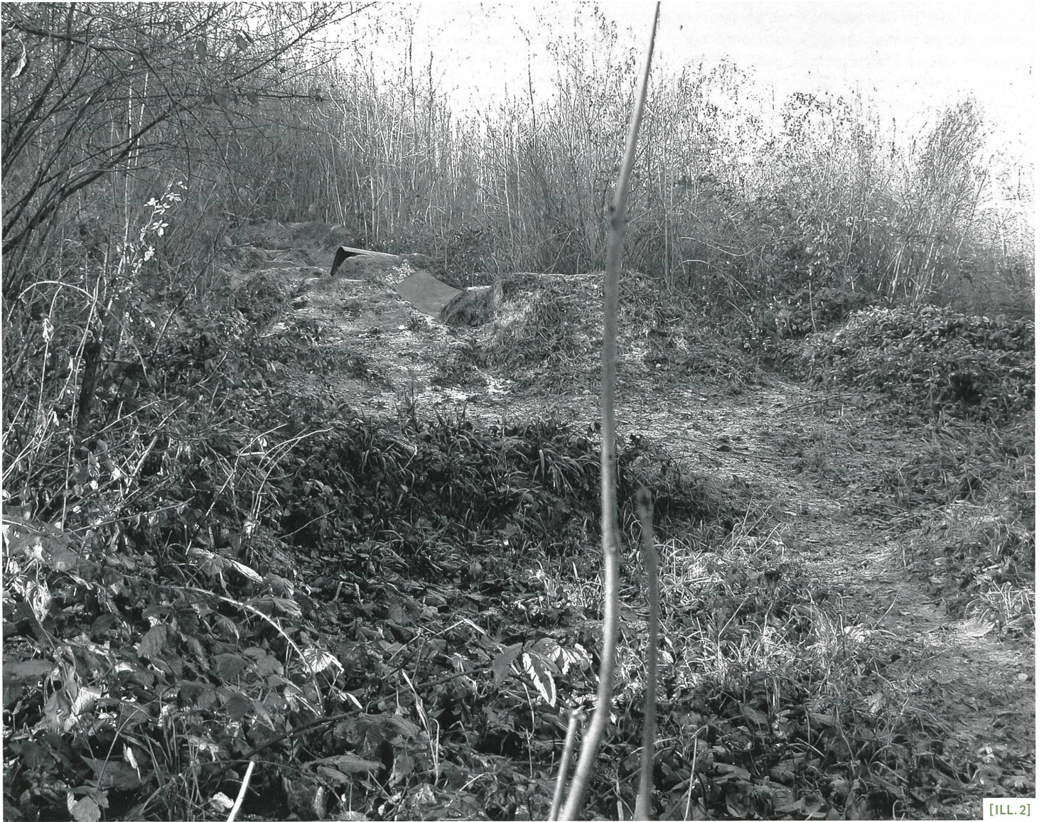
[ILL. 2] Un parcours de BMX comme usage possible de friches urbaines dans les projets d'étudiants