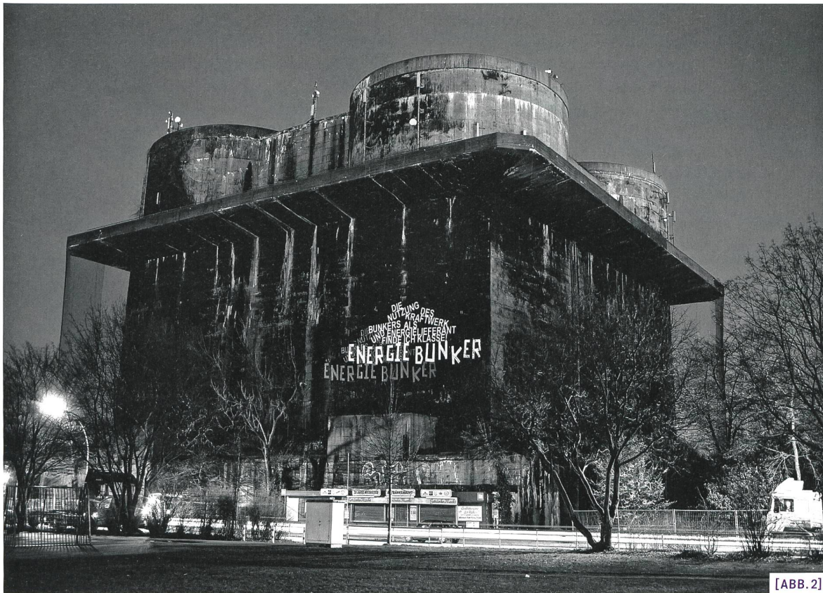
[ABB. 2] Projekt «Energiebunker». Durch die IBA bekommt der Bunker als Teil des Energiekonzepts «Erneuerbares Wilhelmsburg» einen neuen Zweck.