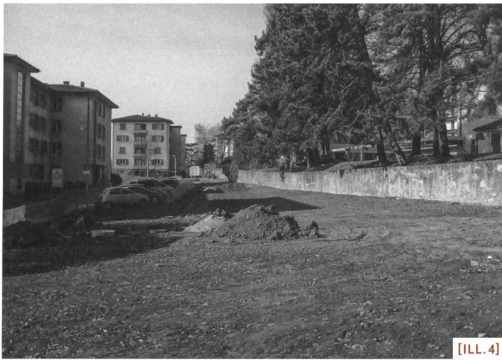
[ILL. 4] Aménagement d'un plantage au chemin de Floreny, Lausanne.

poser un dépassement des zones dans un nouveau paradigme d'aménagement, plus proche des contextes locaux.