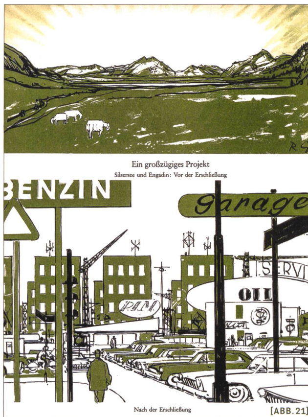
[ABB. 21] ... Interpretationen zu deren zukünftiger Entwicklung.

Der Raumplaner entwickelt sich immer mehr Richtung Koordinator, Kommunikator und Manager. Einerseits ist das hilfreich in der Projektentwicklung und für die Projektumsetzung. Andererseits ist dies auch mit Kreativitätsverlust unter den Raumplanungsfachleuten verbunden. Die verfliegende Kreativität und der Mut zu unkonventionellen, aber sinnvollen und zukunftsfähigen Lösungen vermisse ich weiterhin unter den Raumplanungsfachleuten, die sich teilweise weiterhin als «Verwalter» hinter Gesetzen, Vorschriften und Regeln verschanzen.