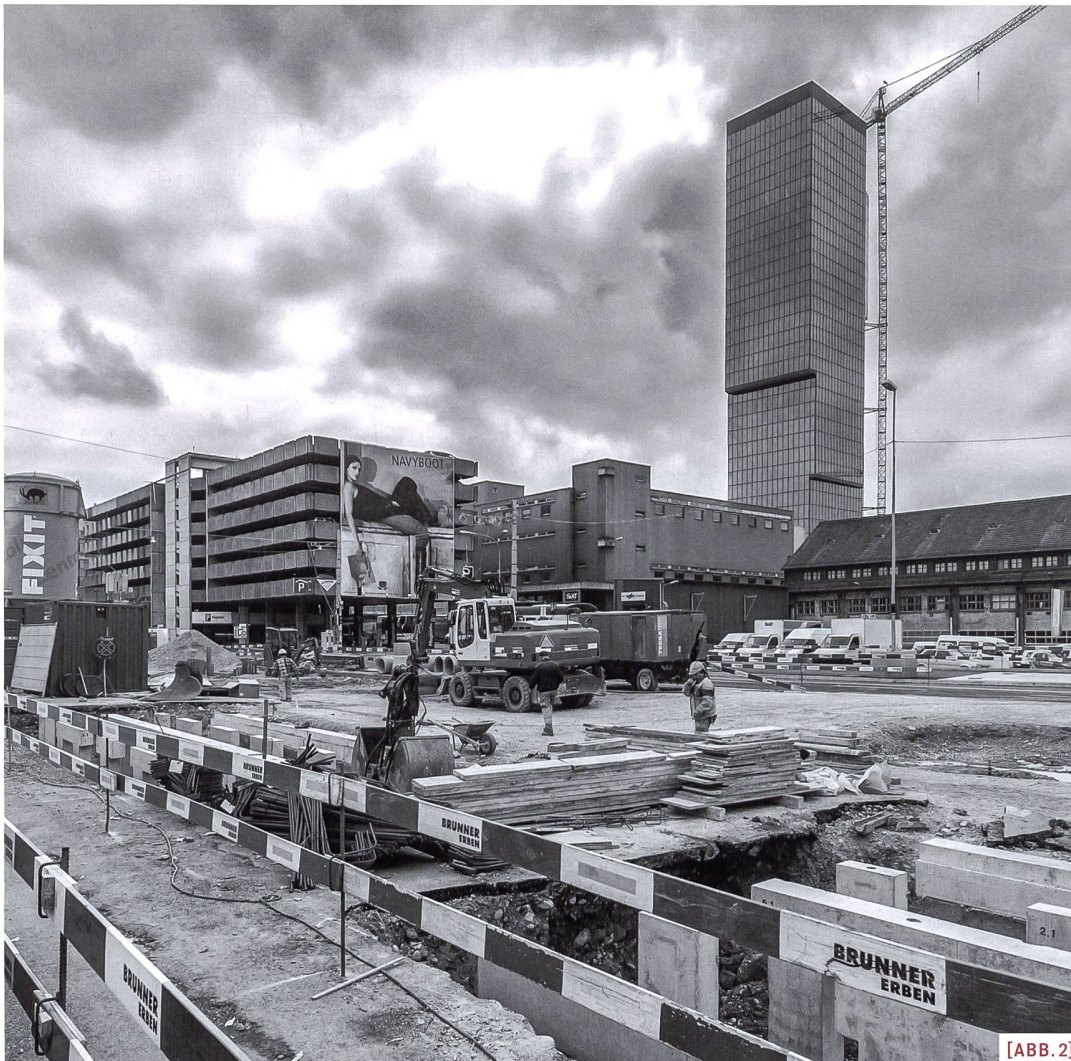
[ABB. 2] Infrastrukturen für Zürich West.

werden die Anforderungen an den Betrieb und den Erhalt der Infrastrukturnetze formuliert. Vereinfachend können sie als Sicherheit, Verfügbarkeit/Funktionsfähigkeit, Umweltschutz und Wirtschaftlichkeit zusammengefasst werden.