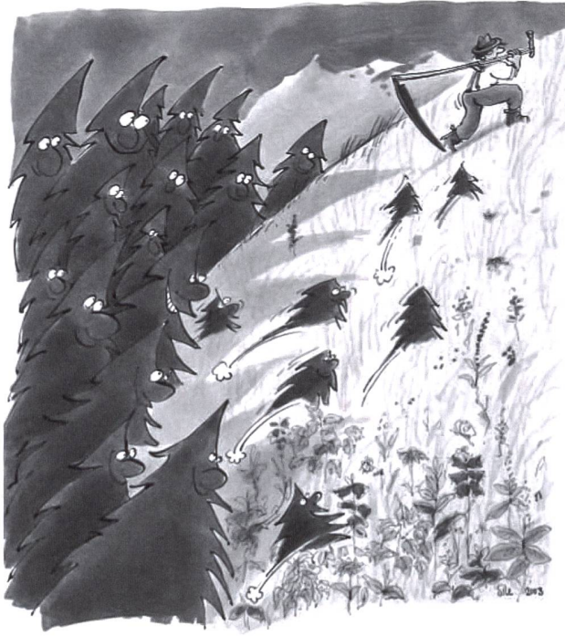
[ABB. 2] Der Bauer geht – der Wald kehrt zurück.

Nutzungseinschränkungen für die Waldeigentümer verringerten. Das Aufkommen fossiler Energieträger dämpfte die Holzpreise deutlich und billigere Lebensmittel schwächten den Anreiz, die landwirtschaftliche Produktion auf Kosten der Waldflächen auszudehnen.