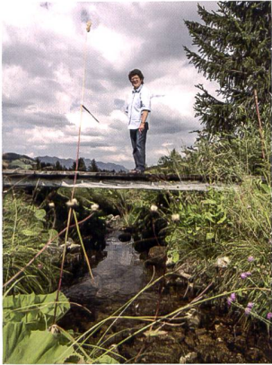
5. Col des Mosses

Zeitschrift für Planung, Umwelt und Städtebau Périodique d'urbanisme, d'aménagement et d'environnement Publikation FSU