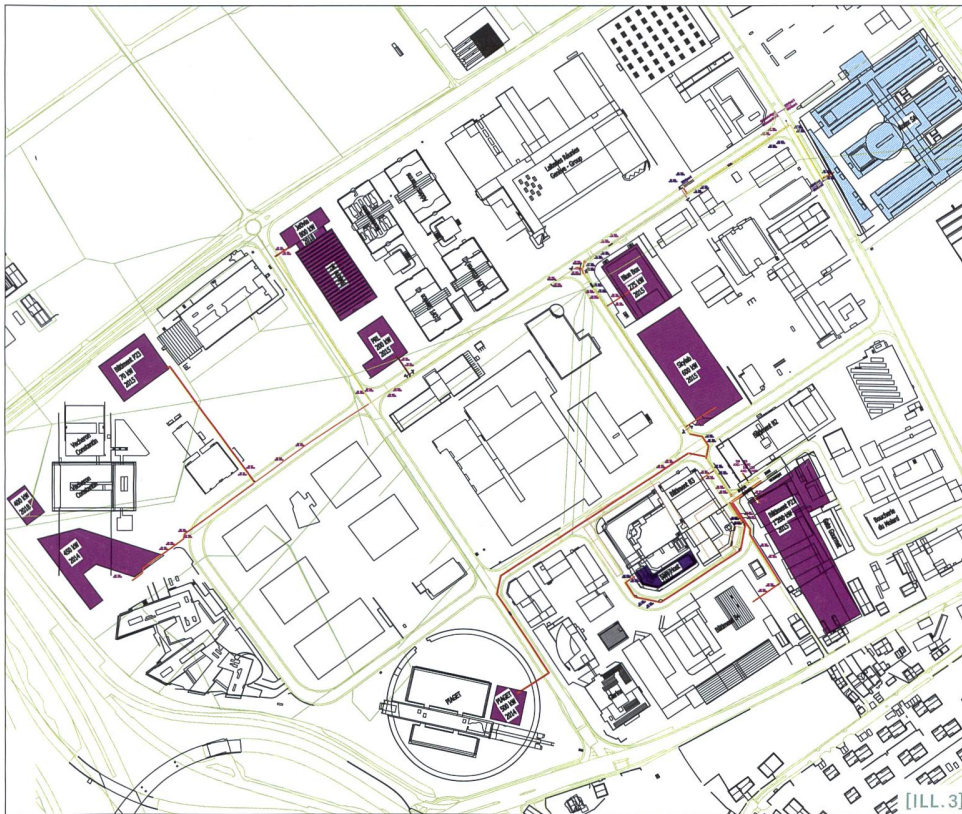
[ILL. 3] Grâce à la mutualisation, 75 % des besoins en chaleur de la zone industrielle de Plan-les-Ouates sont assurés par la récupération des rejets thermiques. En bleu les bâtiment produisant un surplus de chaleur, en violet les bâtiments recevant la chaleur.