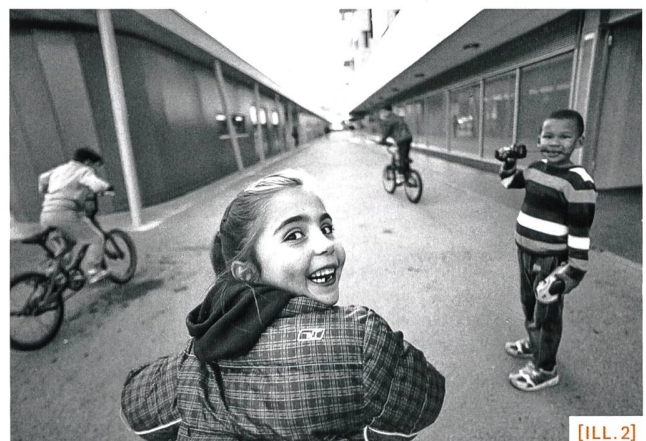
[ILL. 1+2] Quartier des Libellules, Vernier (GE).