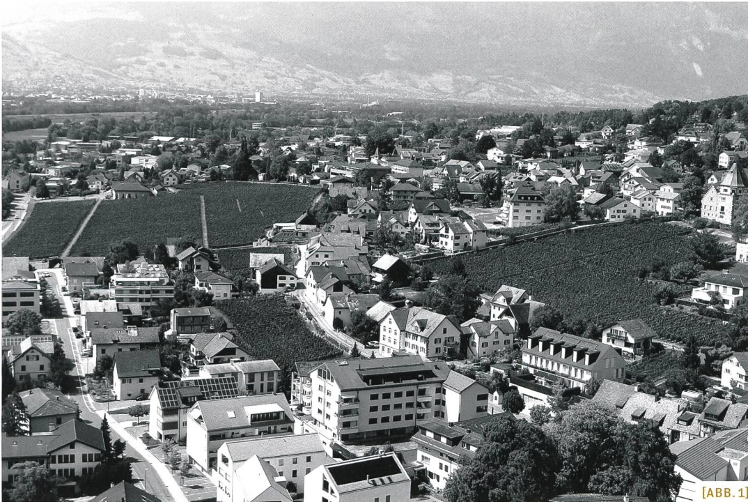
[ABB. 1] Siedlung von der Landschaft herdenken, Liechtenstein 2018.

Professorin für Raumentwicklung, Universität Liechtenstein, Institut für Architektur und Raumentwicklung.