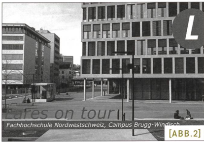
[ABB.2] Was wurde umgesetzt? An der jährlichen Veranstaltung Lares on tour finden Begehungen realisierter Lares -Projekte statt.