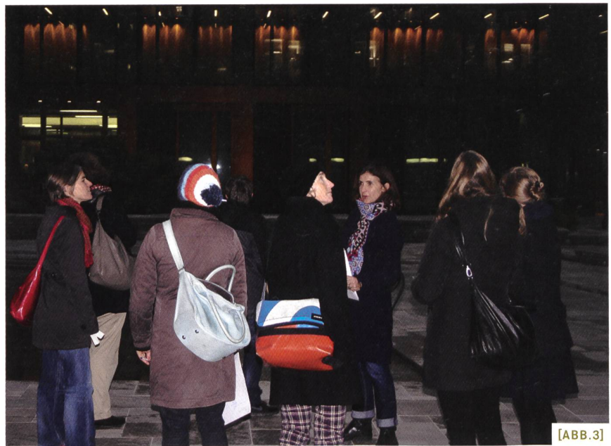
[ABB.3] Während einer Besichtigung in der Dämmerung entstehen lebhafte Diskussionen von Vereinsmitgliedern und Interessierten mit den Lares -Fachfrauen, die das Projekt «Stadtraum HB/Europapallee Zürich» aus Gendersicht beurteilen.