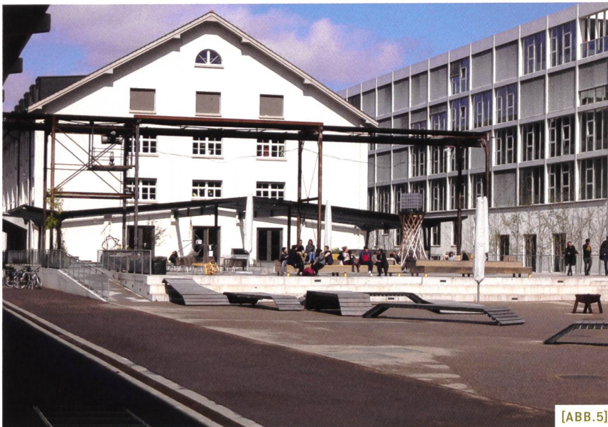
[ABB.5] Dreispitz: Hochschule für Gestaltung und Kunst, Basel/Münchenstein, Genderbeurteilung 2010.