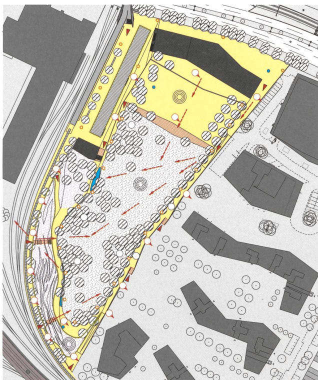
[ABB. 3] Plan soziale Nachhaltigkeit – Gender Mainstreaming.