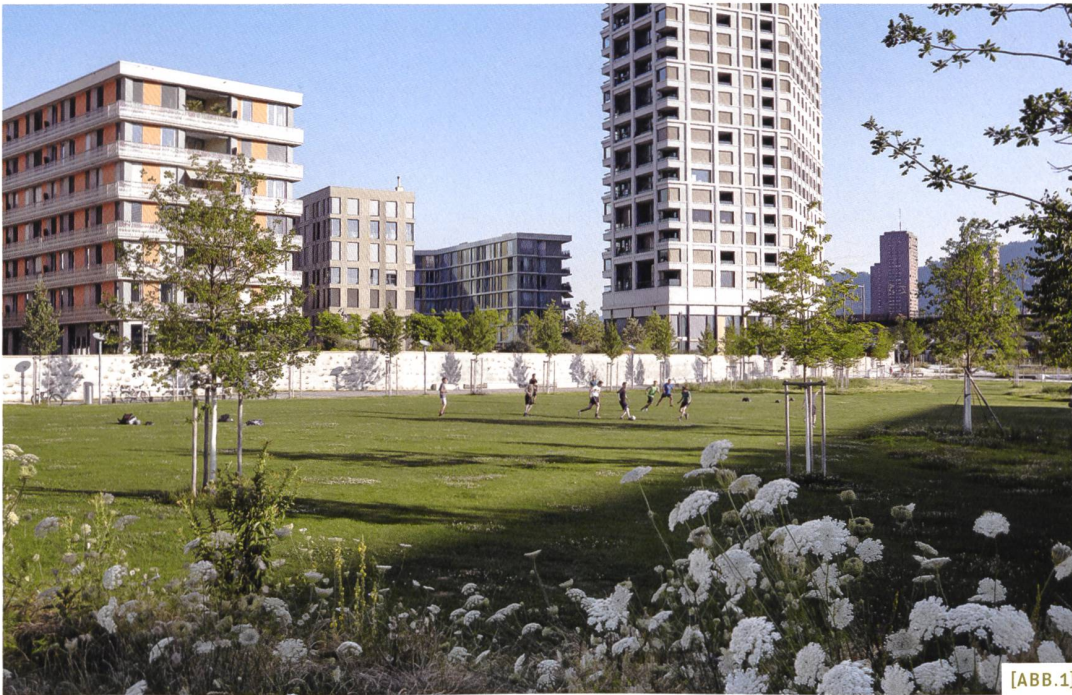
[ABB. 1] Der Pfingstweidpark verfügt über vielfältige Nutzungsangebote.

Das Beispiel des Pfingstweidparks zeigt, wie die unterschiedlichen Bedürfnisse der verschiedenen Menschen, die den Park nutzen, dank einer Genderbeurteilung angemessen im Planungsprozess berücksichtigt wurden.