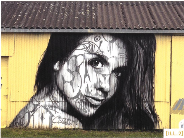
[ILL. 2] Dialogue avec le cadre de l'interaction / Dialog mit Interaktionsflächen / Dialogo con il quadro d'interazione

demander à quiconque d'avoir un comportement qui lui soit économiquement défavorable, sauf en situation de risque soudain et aigu, ce qui n'est pas – dans l'état présent – le cas du climat. La définition de ce cadre tient donc un rôle tout à fait déterminant (voir par exemple la taxe CO 2 ), et une réflexion approfondie doit être engagée sur les leviers les plus efficaces à mettre en œuvre rapidement. Le second registre partage la responsabilité de la ville réalisée avec les décideurs, les porteurs de projet et les citoyens. En particulier son adaptation aux conditions actuelles et surtout futures. Lors de ces processus, il faut délibérer, puis agir, et enfin être attentif aux résultats de manière à réajuster l'action future. Dans ce domaine, le mode de travail avec l'ensemble des parties prenantes compte tout autant que le design de l'espace. Face à l'urgence climatique, les influences des groupes organisés se font désormais ressentir (comme les jeunes pour le climat). Ce sont des alliances à ne pas sous-estimer dans la nécessaire conduite de la transition climatique.