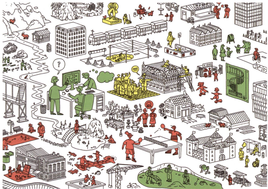
[ABB.1] Baukultur ist vielfältig und umfasst alle Tätigkeiten, die den Raum verändern. Sie verbindet Vergangenes mit Zukünftigem und das handwerkliche Detail mit der grossmasstäblichen Planung. Durch die Baukultur prägen die Menschen den Raum; dieser Raum prägt seinerseits die Menschen. (Quelle: BAK / Illustration Büro Berrel Gschwind)

Das Konzept einer hohen Baukultur wird beim Bund seit 2016 aktiv verfolgt. Dann wurde die interdepartementale Arbeitsgruppe Baukultur gegründet, in der 15 Bundesstellen vertreten sind, und mit der Erarbeitung der «Strategie Baukultur» begonnen. Das Bundesamt für Kultur koordiniert die baukulturellen Tätigkeiten des Bundes und erarbeitet Grundlagen für die Umsetzung einer hohen Baukultur in der Schweiz. Im Folgenden werden drei zentrale Instrumente des Bundesamts für Kultur für eine hohe Baukultur vorgestellt.