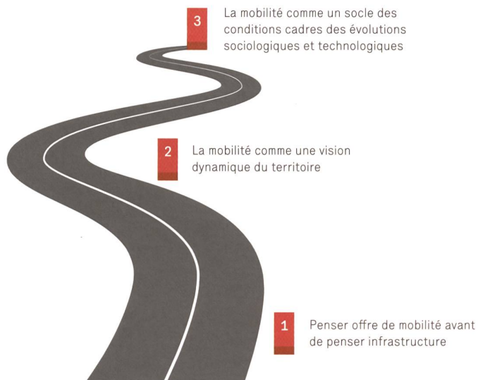
[ILL.11] Chemin de planification / Planungsweg / Percorso di pianificazione

que la prise en compte des particularismes locaux, des habitudes des usagers du lieu, des aspects identitaires nous paraît impérative. Selon nous, cette réponse quasi organique, activant les sens, doit permettre de créer des espaces vivants, adaptés aux attentes des populations locales. Cette approche vise également à éviter un effet de «clonification» des espaces publics, qui fleurissent depuis une vingtaine d'années. Le travail entamé en zone urbaine doit aujourd'hui regarder vers les marges de l'urbanisation, puis vers l'extérieur de la ville.