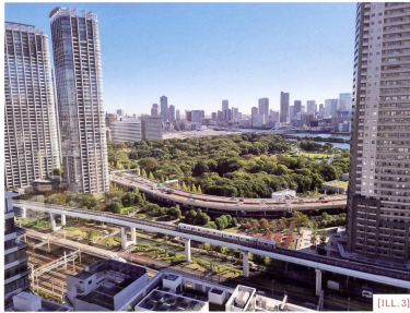
[ILL. 3] De la ville des flux à la ville flux: shinkansen, jardin Hamarykyu et front de mer verticalisé / Dalla città dei flussi alla città flusso: lo shinkansen, il parco Hamarykyu e il lungomare verticalizzato / Von der Stadt der Flüsse zur Stadt im Fluss: Shinkansen, Hamarykyu-Park und vertikalisierte Uferpromenade