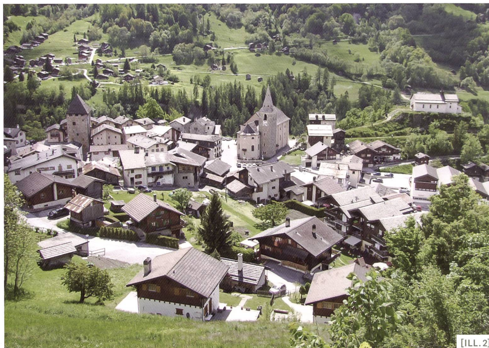
[ILL.2] Village de Vissoie dans la commune de Val d'Anniviers / Il villaggio di Vissoie sul territorio comunale di Val d'Anniviers / Das Dorf Vissoie in der Gemeinde Val d'Anniviers