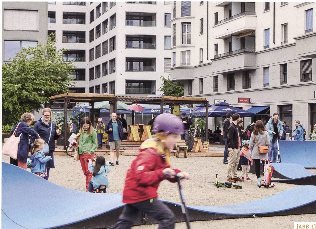
[ABB.1] Dietikon: Ein Pavillon als Grundstruktur für die Belebung eines Quartiertreffpunkts/ Dietikon: un pavillon comme structure de base pour animer un centre de rencontre de quartier / Dietikon: un padiglione quale struttura di base per fare vivere un punto d'incontro nel quartiere

MSc. Urban Design, MAS Raumplanung ETH, Denkstatt sàrl