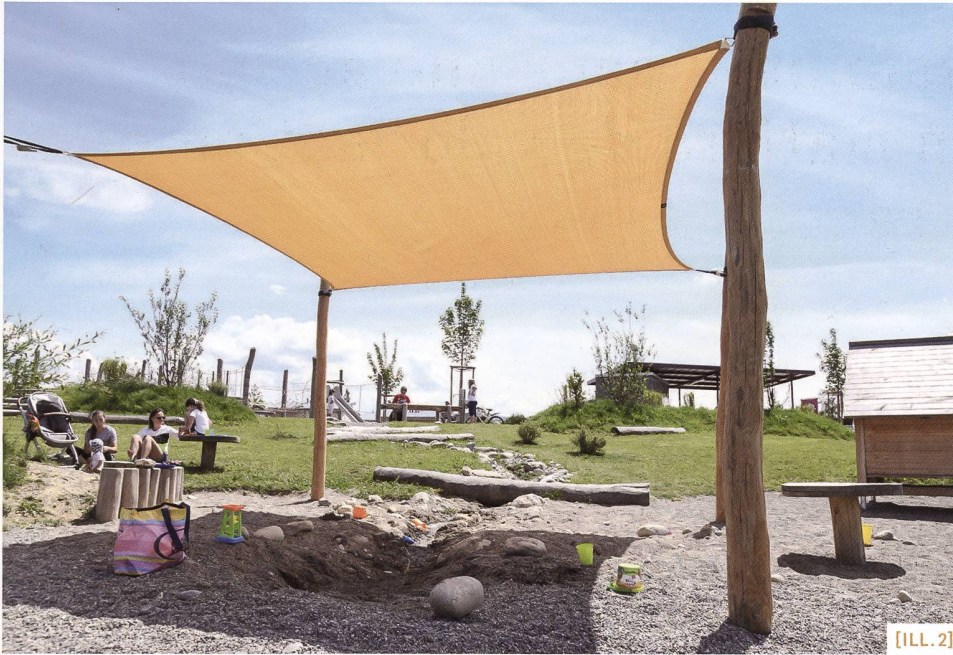
[ILL. 2] Parc du Maggenberg à Fribourg : aménagement d'un espace ouvert convivial réalisé dans le cadre du projet « Fribourg (ou)vert ». / Maggenbergpark in Freiburg: Gestaltung eines gemeinschaftlichen Freiraums im Rahmen des Projekts « Grünraum Freiburg ». / Parco del Maggenberg a Friburgo: intervento per creare uno spazio accogliente nell'ambito del progetto « Fribourg (ou)vert ».