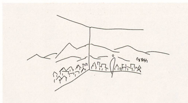
[ILL.2] Rapporto con il paesaggio / Beziehung zur Landschaft / Rapport avec le paysage