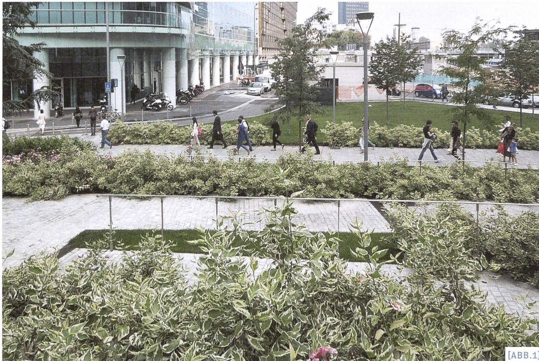
[ABB.1] Innerstädtische Grünverbindung bei Stazione Garibaldi / Corridor vert à l'intérieur de la ville, aux abords de la gare Garibaldi / Corridoio verde intraurbano presso la stazione di Porta Garibaldi

Landschaftsarchitekt & Stadtplaner, Geschäftsführender Gesellschafter des Beratungs- und Planungsunternehmens LAND mit Niederlassungen in Mailand, Düsseldorf, Wien und Lugano