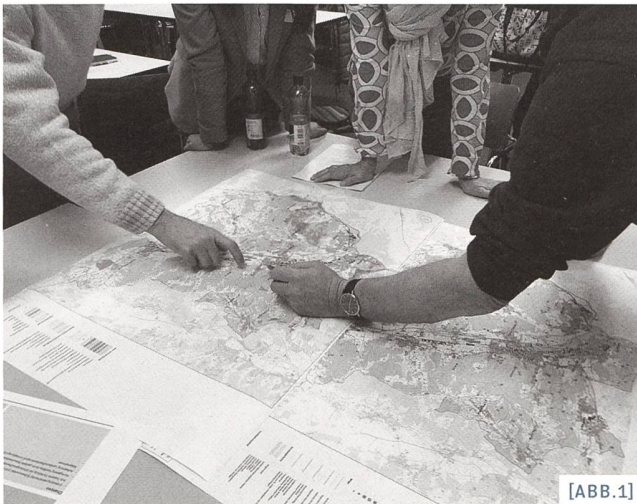
[ABB.1] Eruiieren des Potenzials und der Konflikte / Identification du potentiel et des conflits / Identificare il potenziale e possibili conflitti

Dipl. Geograph, Raumplaner FSU Regionalplaner im Regionalverband zofingenregio und Geschäftsführer des Vereins AareLand