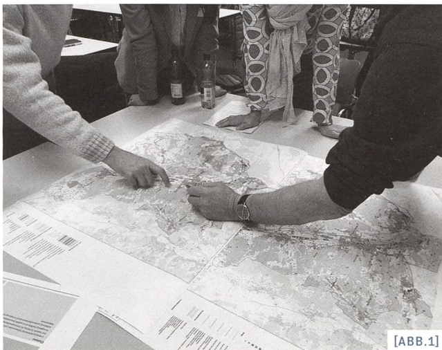
[ABB.1] Eruiieren des Potenzials und der Konflikte / Identification du potentiel et des conflits / Identificare il potenziale e possibili conflitti

Dipl. Geograph, Raumplaner FSU Regionalplaner im Regionalverband zofingenregio und Geschäftsführer des Vereins AareLand