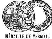
MÉDAILLE DE VERMEIL