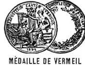
MÉDAILLE DE VERMEIL