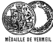
MÉDAILLE DE VERMEIL