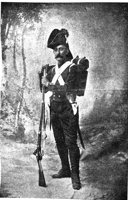
Grenadier vaudois en 1803. 1

(Uniforme bleu foncé ; parements, col et passepoils rouges ; chapeau retroussé ; buffleterie blanche ; épaulettes et panache rouges. — Fusil à silex ; sabre à poignée laiton.)