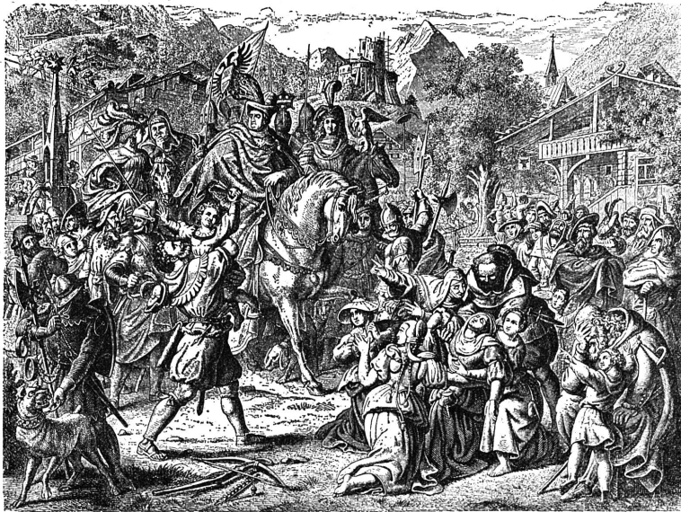
— POUR LA LIBERTÉ! — GUILLAUME-TELL ET GESSLER