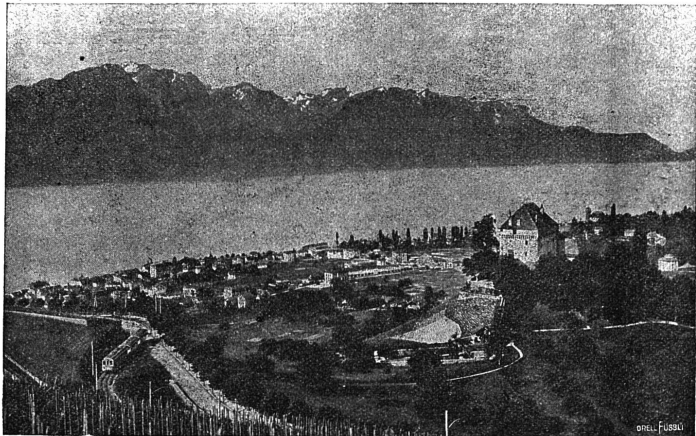
CLARENS ET LE CHATELARD