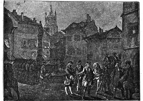
L'arrestation de Davel à Lausanne

carna le personnage du martyr vaudois. Les deux fois le succès fut très grand. Il ne le sera certainement pas moins cette fois-ci, d'autant, nous l'avons dit, que la pièce sera montée avec un grand luxe et admirablement interprétée par les Muséens.