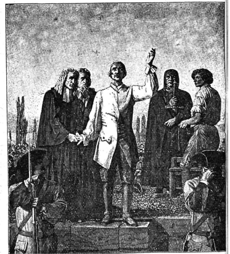
L'exécution du Major Davel à Vidy, près de Lausanne d'après le tableau du peintre Ch. Gleyre.

Au commencement du XVIII e siècle, la veste était presque aussi longue que le justaucorps. En 1812, elle devient le gilet.