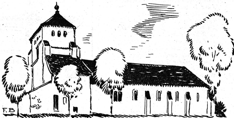
LE CHATEAU DE BONMONT

A NCIEN monastère, c'est aujourd'hui une propriété particulière, près de Cheserex, au pied des grandes forêts du Jura.