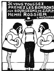
Henri ROSSIER et ses Fils successeurs

Elaboration de plans de réclame, Répartition et contrôle de budgets par voie de journaux, affichage, imprimés, etc.