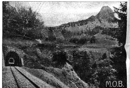
La Dent de Jaman.

Chemin de fer électrique Montreux-Oberland Bernois.