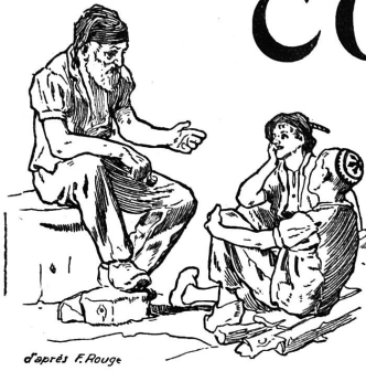
d'après F. Rouge

Rédaction et Administration : Imprimerie PACHE-VARIDEL & BRON , Lausanne Pré-du-Marché, 7