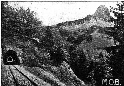
Le tunnel et la Dent de Jaman

Chemin de fer électrique Montreux-Oberland bernois