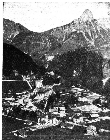
Les Avants et la Dent de Jaman

Chemin de fer électrique MONTREUX-OBERLAND BERNOIS