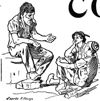
d'après F. Rouge

Rédaction et Administration : Imprimerie PACHE-VARIDEL & BRON , Lausanne Pré-du-Marché, 7