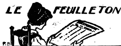
LA MÈRE Roman inédit.

— Je vous demande pardon, j'en suis sûr, j'étais témoin à leur mariage.